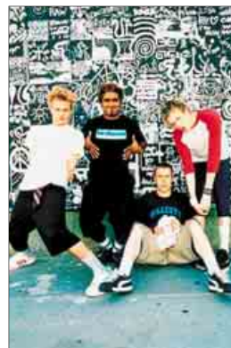
Los integrantes del grupo Sum 41.

Dcode. www.dcodefest.com . C. D. Cantarranas. Entradas en Livenation, Ticketmaster, Servicaixa y El Corte Inglés.