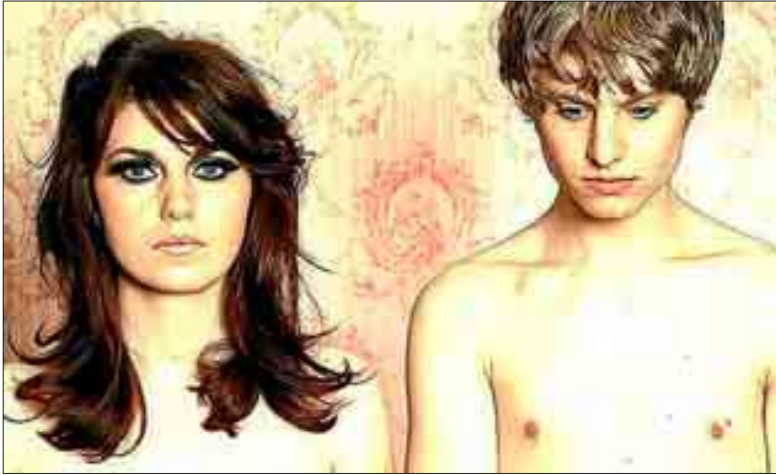
Componentes del grupo Blood Red Shoes.